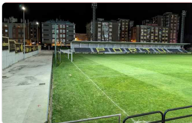
Campo de Portugalete