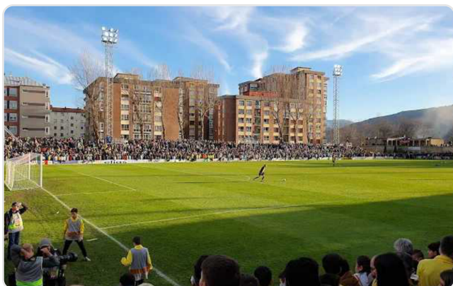
Campo de Portugalete